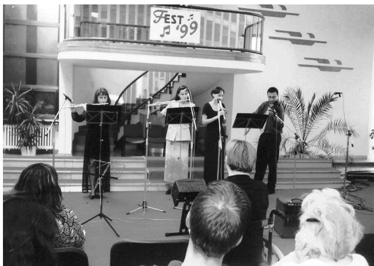
Bogat glazbeni život Crkve: FEST 99 u Maruševcu