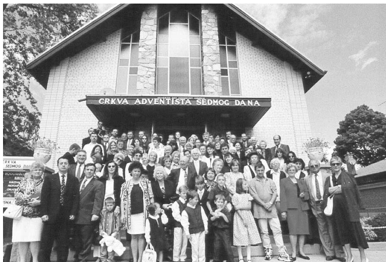
Etnička adventistička Crkva u Torontu