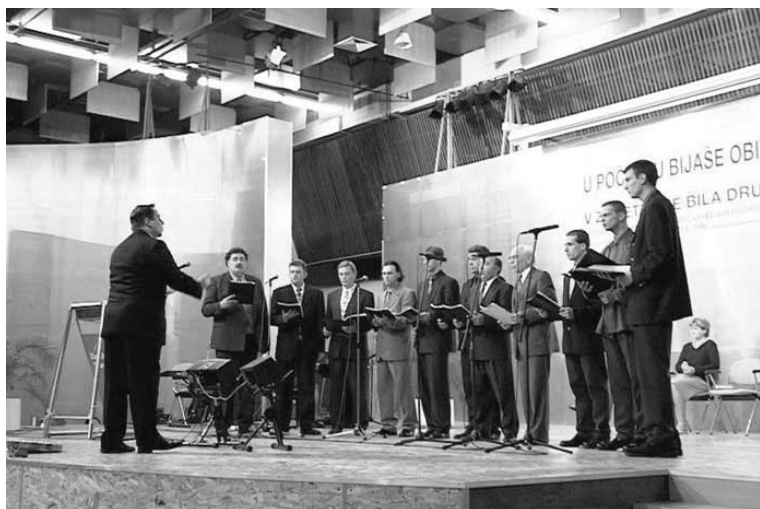
S kongresa adventista “U početku bijaše obitelj”