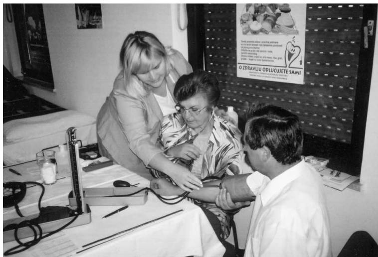
“Dan srca” u Oroslavju, 2000. godine