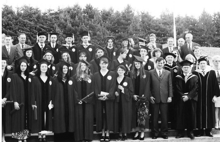
Završna svečanost u Adventističkom učilištu