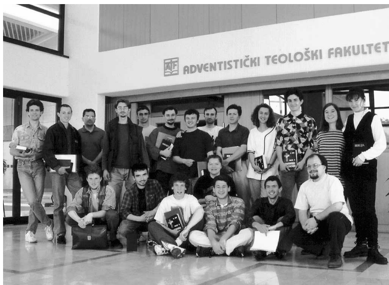
Adventistički teološki fakultet privlači mlade na studij