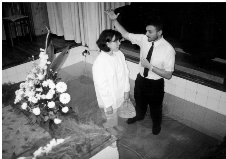
“Tko uzvjeruje i krsti se, spasit će se.”