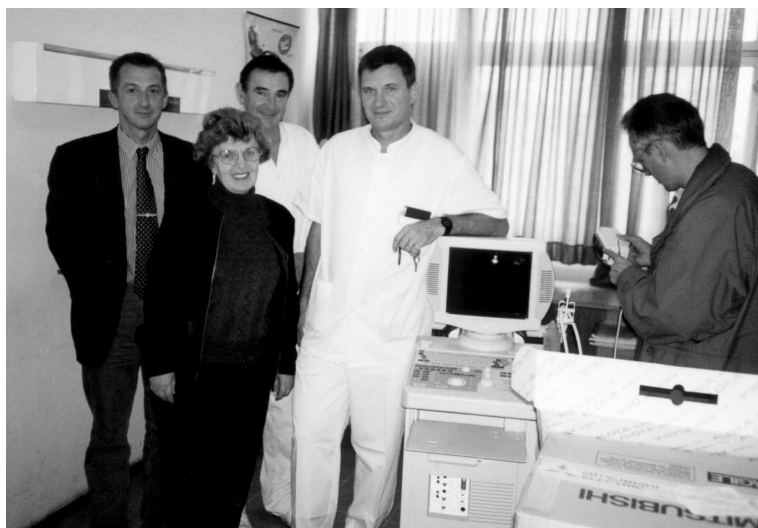
ADRA predaje dragocjeni dijagnostički aparat Dječjoj bolnici u Splitu