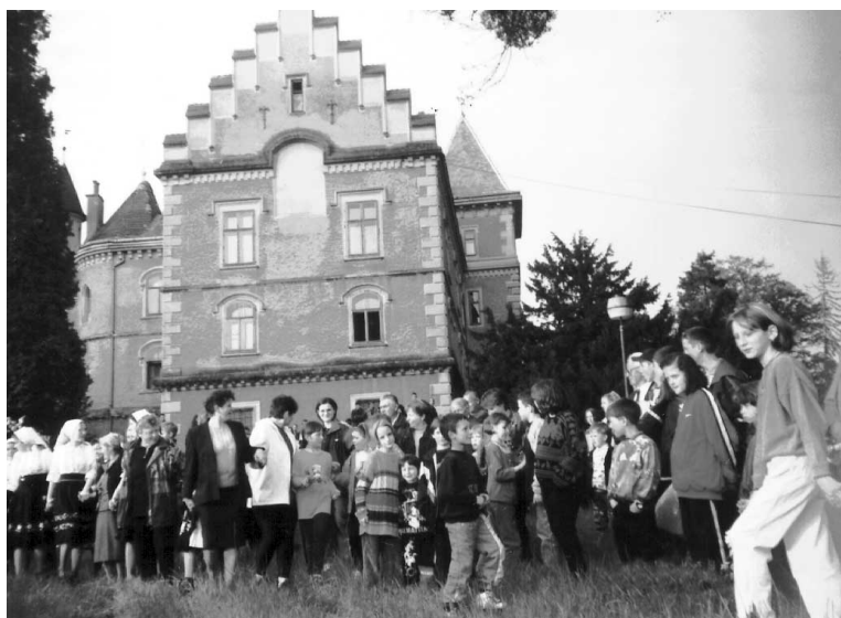
Mladi adventisti kraj starog dvorca u Maruševcu