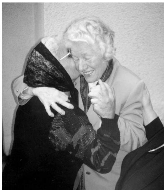
Humanitarni rad temeljni je rad Crkve: Susret donatora i prognanika