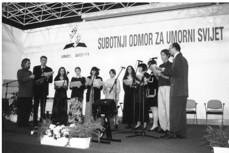
Pjevači na kongresu: “Subotnji mir za umorni svijet”