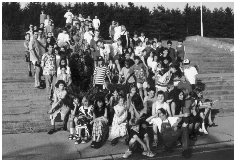
Briga o djeci: Ljetni biblijski tečaj u Maruševcu