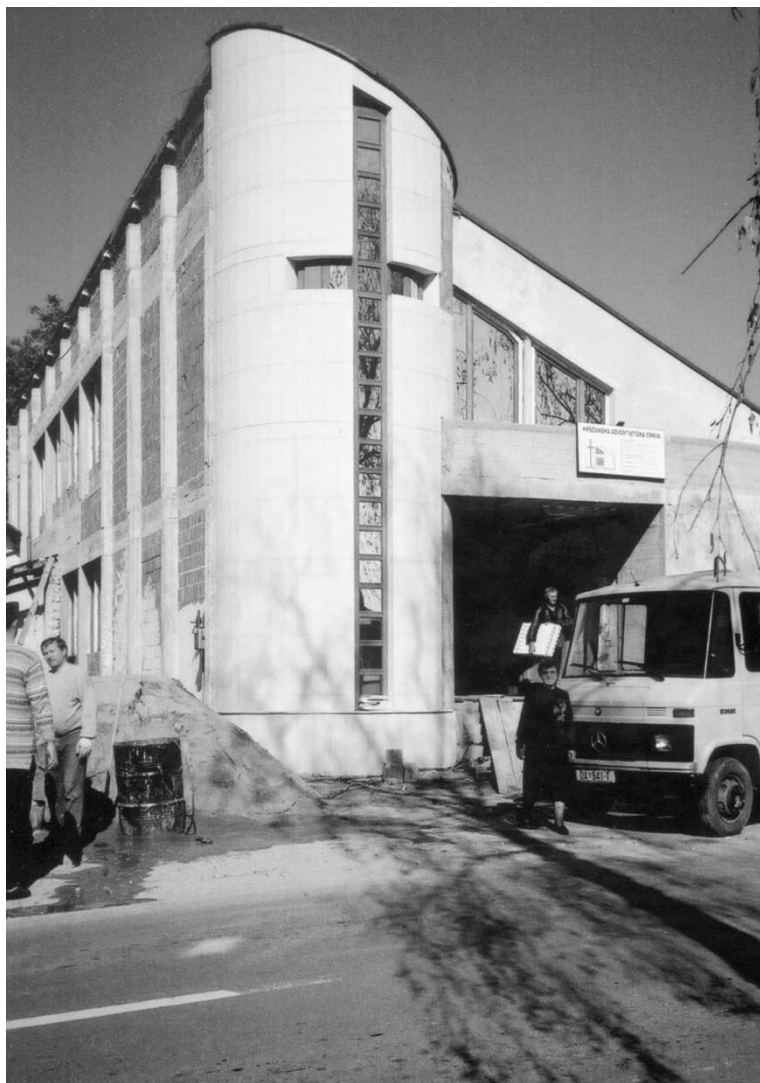
Lipik – Kršćanska adventistička crkva u izgradnji