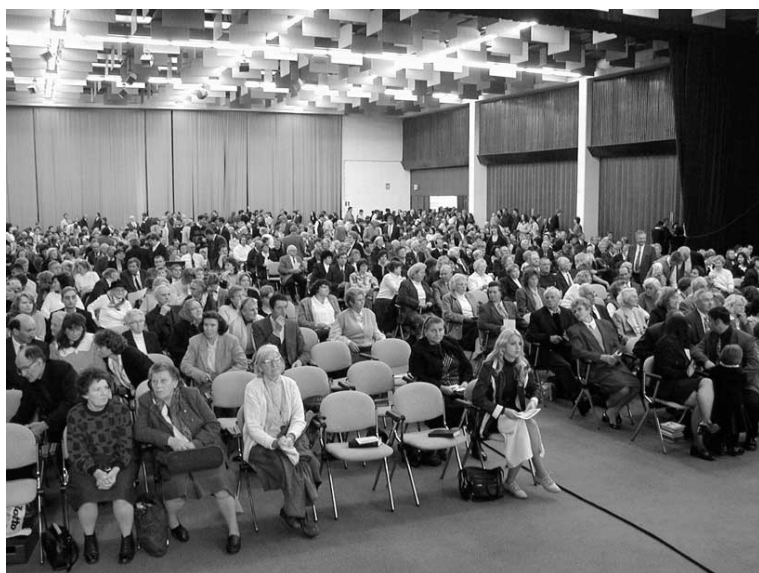
Kongres u dvorani Globus na Zagrebačkom velesajmu