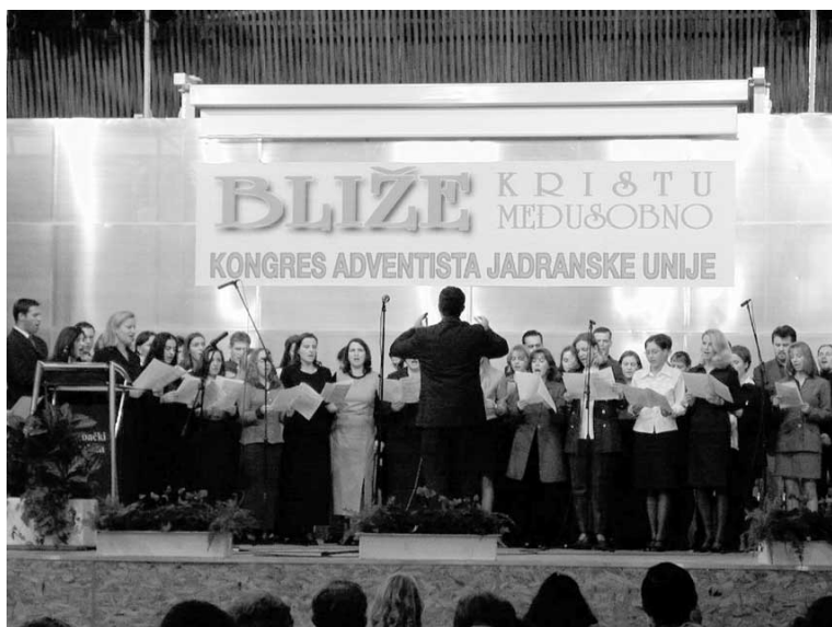
S kongresa adventista “Bliže Kristu – bliže međusobno”