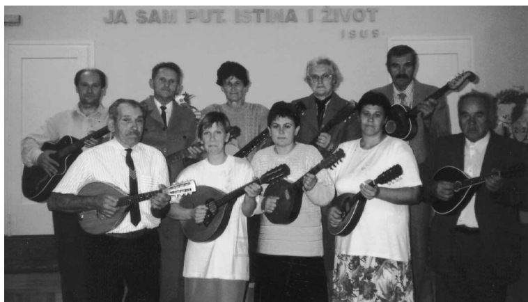
Instrumentalni sastav na tradicijskim glazbalima